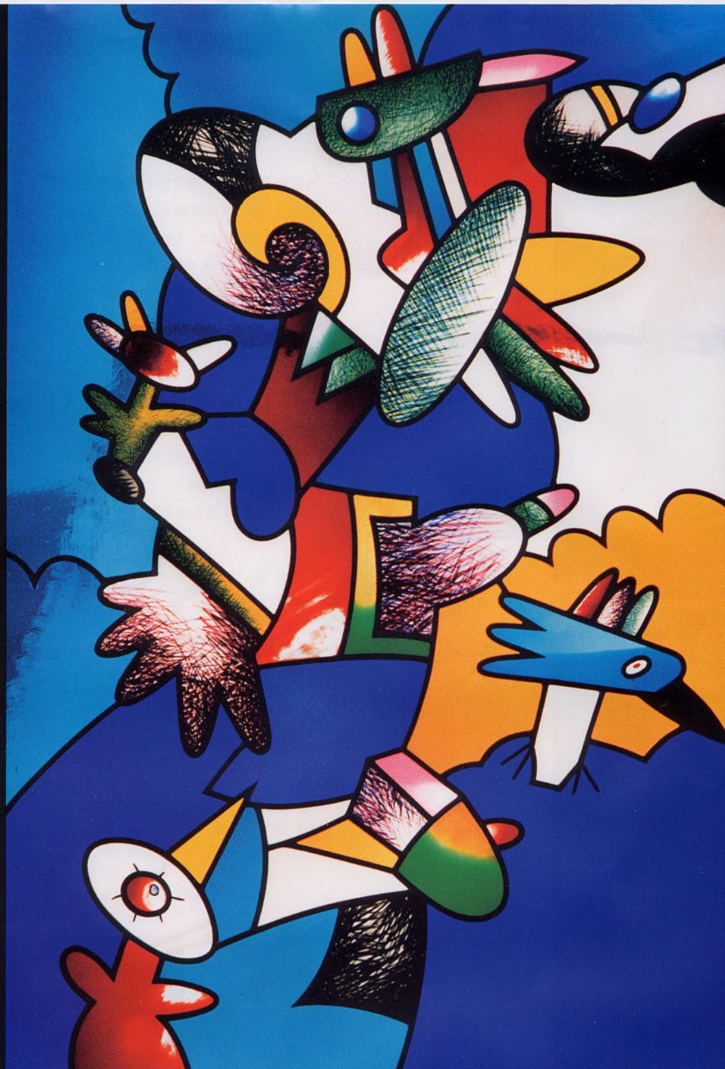
オットマー・オルト(ドイツ) 750×1000